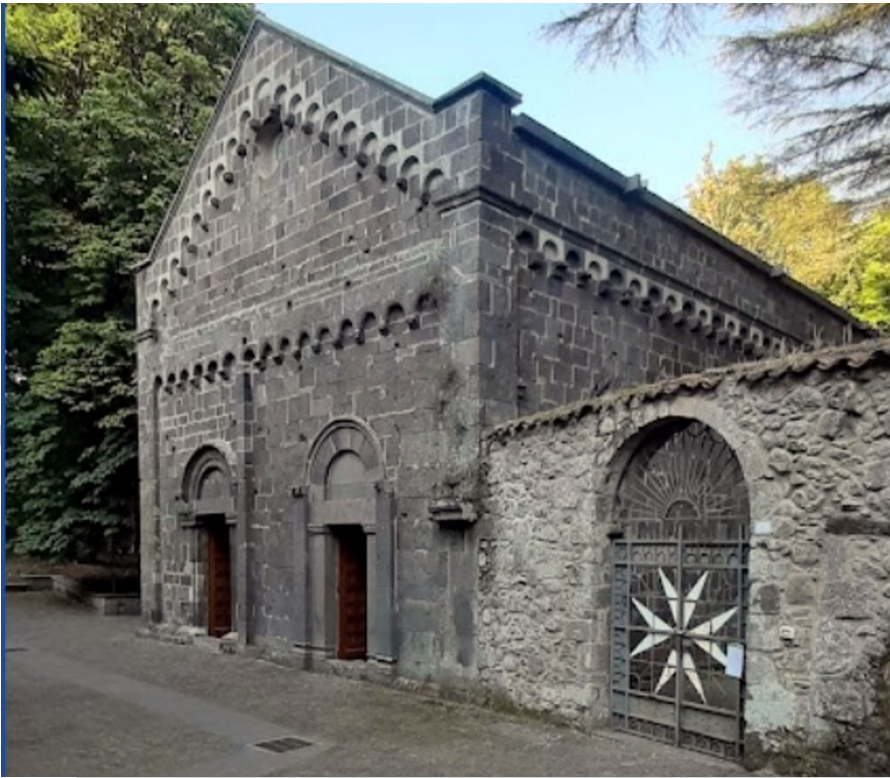
San Leonardo delle Sette Fontane (Oristano), da Google maps, foto di Carmen Cannarella, agosto 2020.

In un registro dei Cavalieri di San Giovanni di Gerusalemme o di Malta si trovano notizie interessanti sull'Ordine nell'ultimo ventennio del settecento. Riguardano il Priorato di Pisa e le sue commende e integrano i ruoli di questi e dei cavalieri già editi, dando ennesima testimonianza – anche se i tempi erano altri – dell'importanza che il Priorato e la sua città ebbero nel passato.