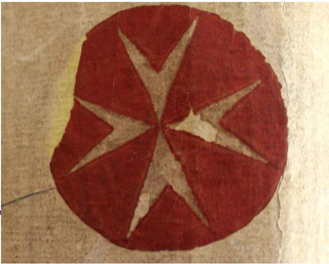
Lo stemma dei Cavalieri di Malta su un faldone d'archivio.