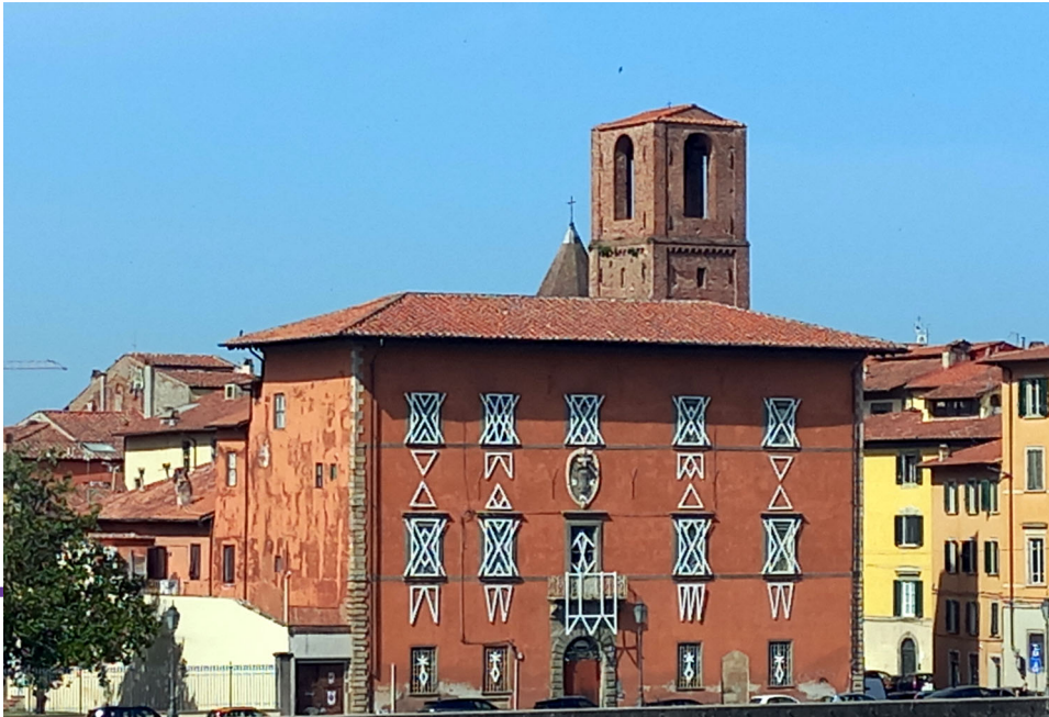
Il Palazzo del Priorato di Pisa, foto di P.I.M., 2022.

Ricetta subito che vacherà la commenda di Mazzara, e dopo il termine del vacante e mortorio della medesima.